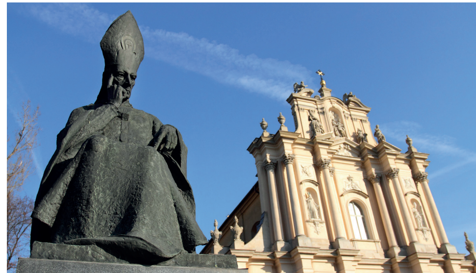
Pomnik bł. kard. Stefana Wyszyńskiego przy Kościele Sióstr Wizytek

Z tym przesłaniem Warszawski Oddział Przewodników PTTK zaprasza braci przewodnicką z całej Polski na XXXIX Pielgrzymkę Przewodników Turystycznych na Jasną Górę.