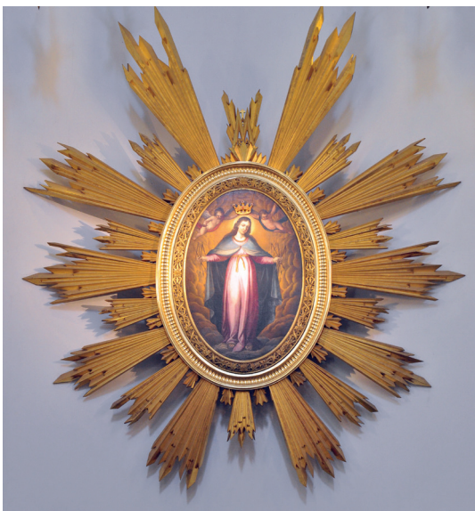
Matka Boża Łaskawa - Patronka Warszawy

Warszawski Oddział Przewodników PTTK zaprasza do udziału w XXXIX Pielgrzymce Przewodników na Jasną Górę w dniach 08 – 10 marca 2024 r.