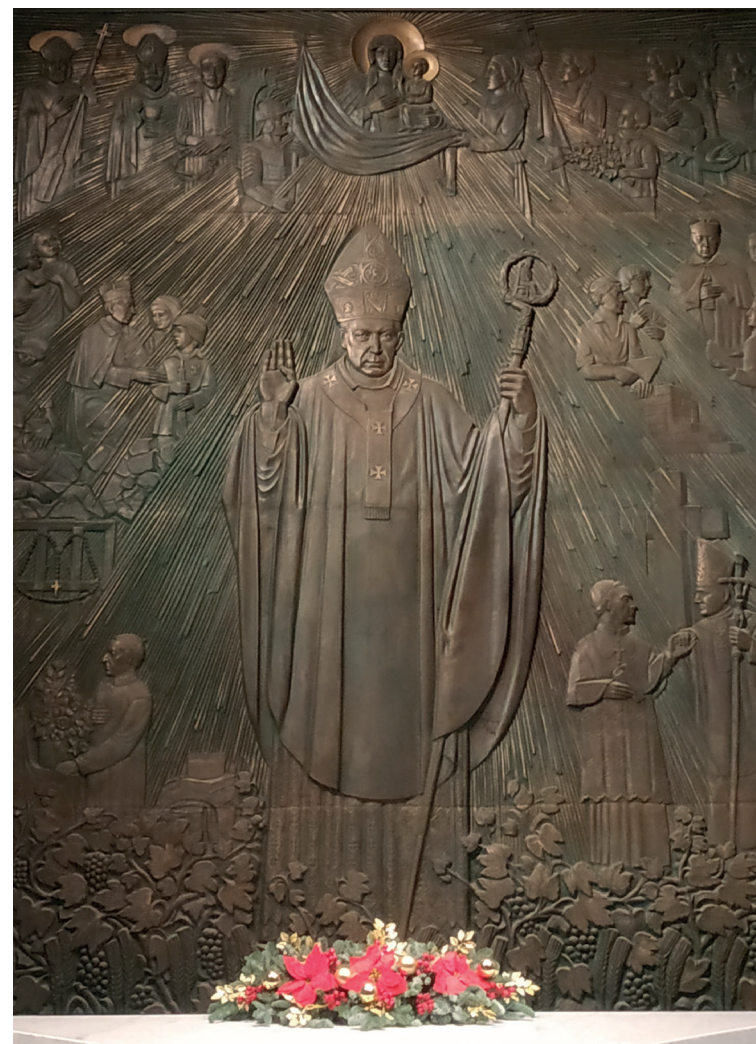
Płyta ukazująca historię życia bł. kardynała Stefana Wyszyńskiego w Archikatedrze św. Jana Chrzciciela