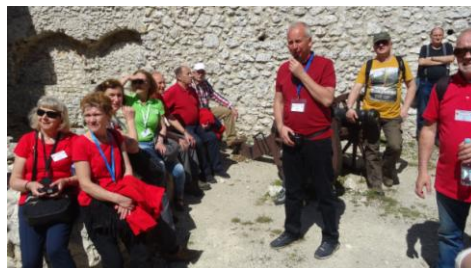
Na zamkowym dziedzińcu