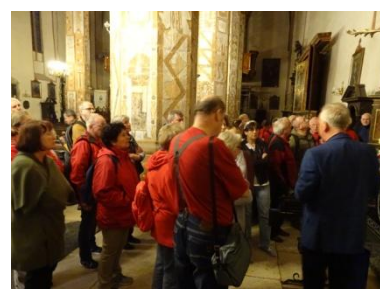
Bazylika p.w. św. Andrzeja

Ciepły, słoneczny dzień zakończył się późną obiadową kolacją w Hotelu Victoria.