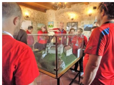
W zamkowej wieży