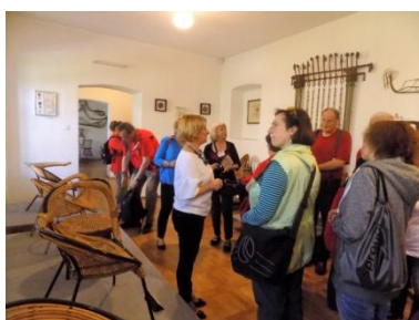
Muzeum Twórczości Władysława Wołkowskiego