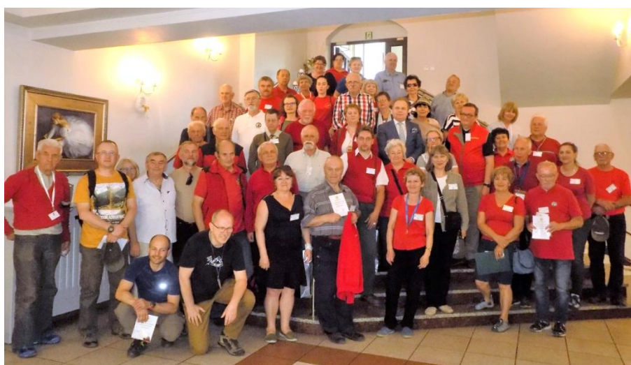
Ostatnie wspólne zdjęcie

Przewodnicy byli zadowoleni z warunków pobytu i smacznego wyżywienia, chwalili organizatorów za ciekawy program i sprawną realizację imprezy, podkreślali miłą atmosferę panującą przez wszystkie dni zlotu. Wszyscy docenili piękną pogodę.