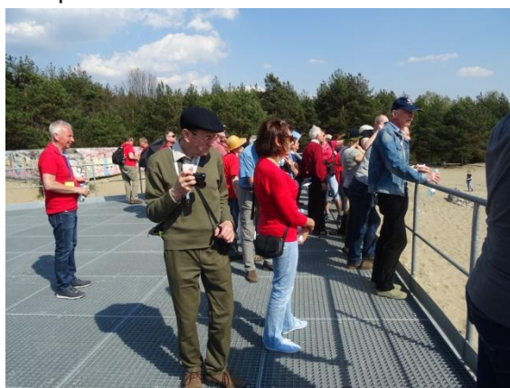
Platforma widokowa w Chechle