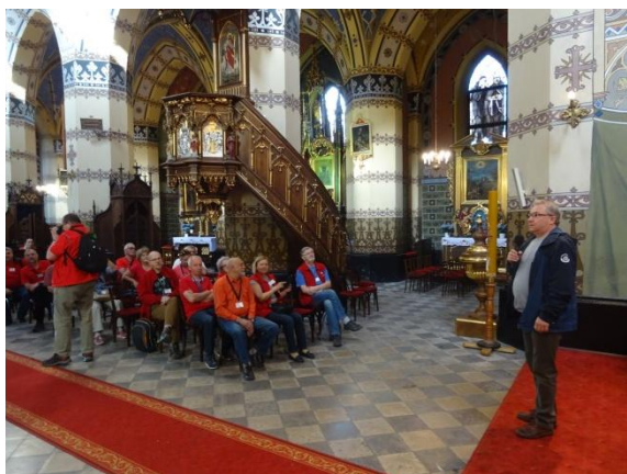
Kościół w Bolesławiu