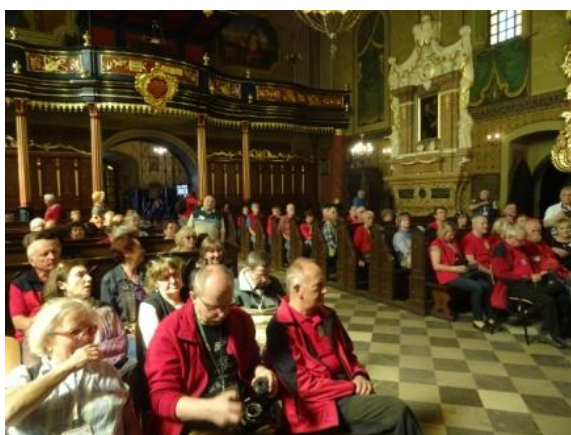
Kościół w Sławkowie