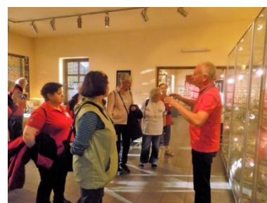
Kolekcja minerałów i skamieniałości