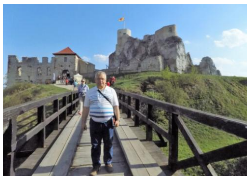
Zamek w Rabsztynie