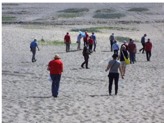
Spacer po Pustyni Błędowskiej i pamiątkowe zdjęcie