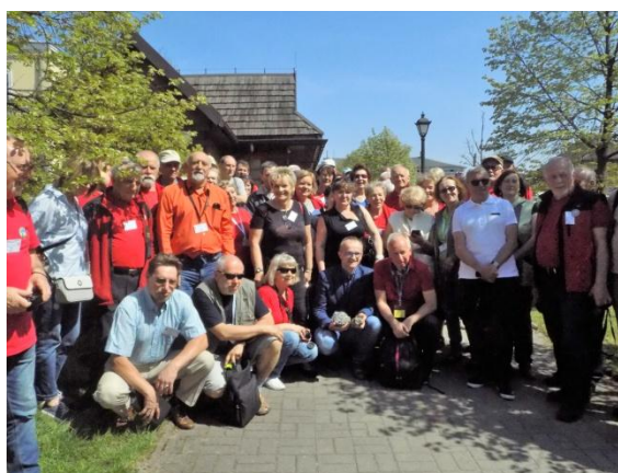
Spotkanie z Burmistrzem Sławkowa