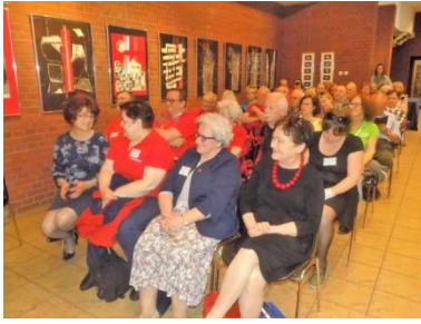
Inauguracja zlotu - sala konferencyjna MOK