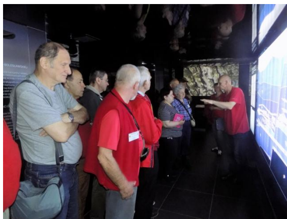
Kopalnia Wiedzy o Cynku